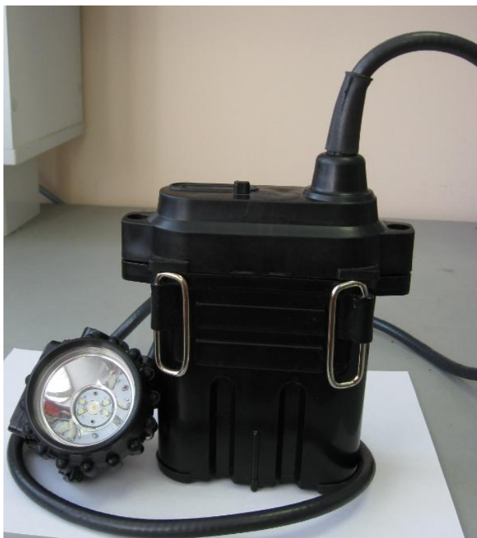
Рисунок 1 - СМГВ, внешний вид

Внешний вид СМГВ представлен на рисунке 1.