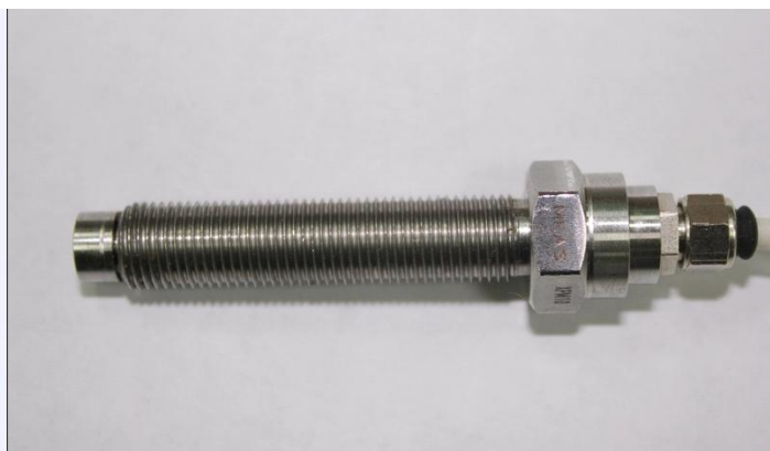
Рис. 1 Внешний вид преобразователя давления измерительного ХРМ10

Преобразователь изготавливается в двух модификациях ХРМ10-S116-5BS-/LC10_RevB и ХРМ10-S116-35BS-/LC10_RevB, различающихся диапазоном измеряемых статических давлений, диапазоном амплитуд пульсаций давления и коэффициентами преобразования.