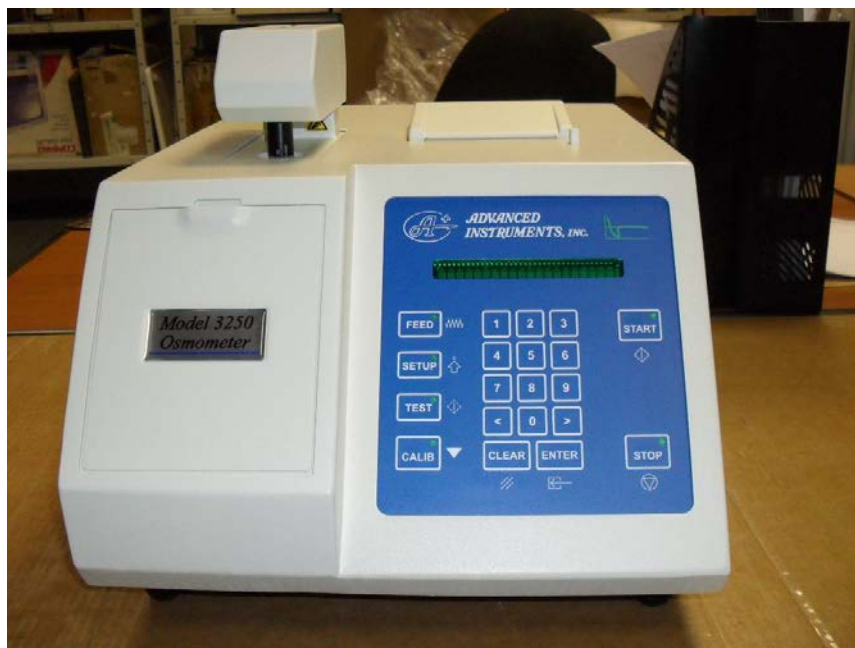
Рисунок 1 – Общий вид осмометра модели 3250

Осмометры выпускаются в настольном стационарном исполнении.