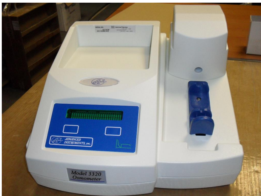
Рисунок 2 – Общий вид осмометра модели 3320