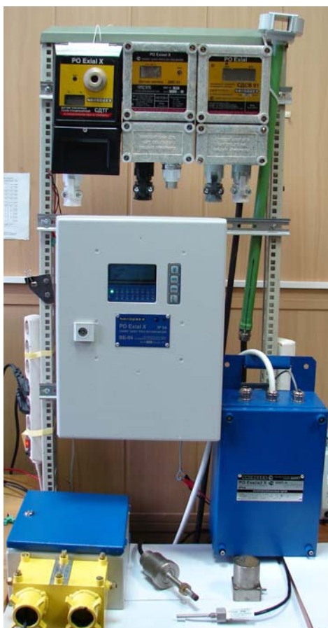
Рисунок 1 – Общий вид технических средств Аппаратуры

Общий вид технических средств Аппаратуры представлен на рисунке 1.