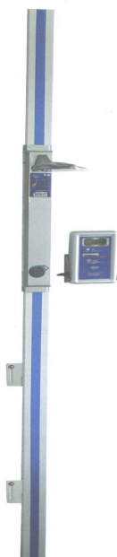
Фотография общего вида РЭС