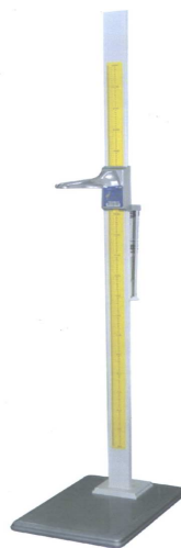
Фотография общего вида РП