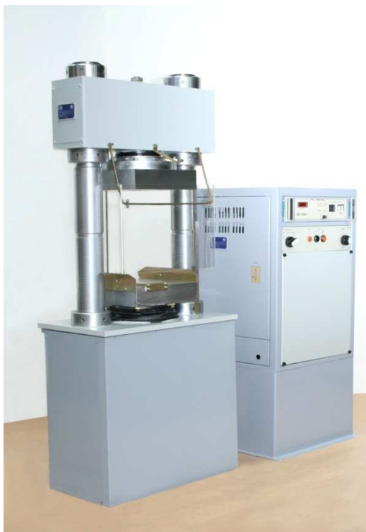
Рис. 1. Общий вид

Машина ИП-100-1 по заказу потребителя оснащена приспособлением для испытаний образцов на изгиб по ГОСТ 10180-90.