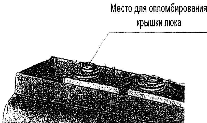
Рисунок 2. Крышка люка, с указанием места пломбы

Места пломбировки полуприцепов-цистерн в целях предотвращения несанкционированной настройки и вмешательства, которые могут привести к искажению результатов измерений, приведены на рис.2 и рис.3.