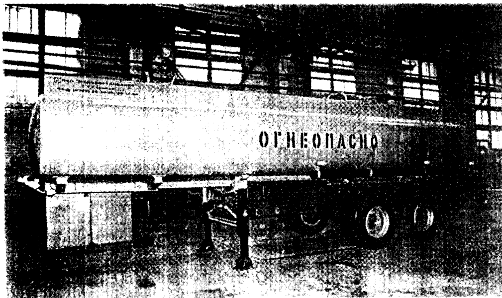
Рисунок 1. Общий вид полуприцепов-цистерн для светлых нефтепродуктов ППЦ-24

Полуприцепы-цистерны являются мерой полной вместимости. Полуприцепы-цистерны безрамные, несущей конструкции, используются совместно с седельными тягачами, допускающими нагрузку на седельно-сцепное устройство и полную массу буксируемых полуприцепов-цистерн. Полуприцепы-цистерны состоят из цистерны, тележки, опорного устройства, тормозного и противопожарного оборудования, электрооборудования, технологического оборудования и оборудования контроля и управления режимами рабочих операций.