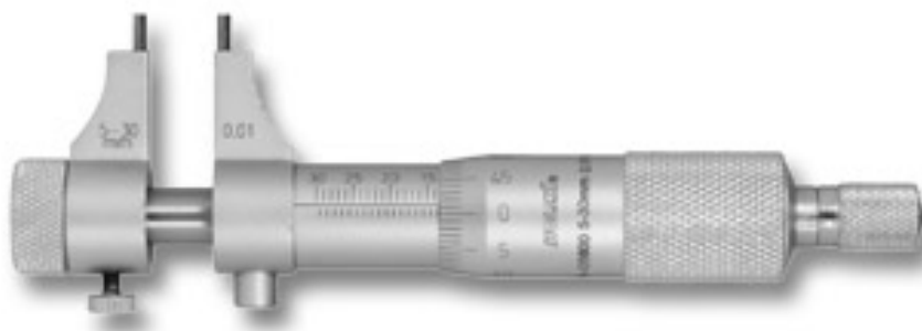
Рисунок 1 – Общий вид нутромеров с диапазоном измерений от 5 до 30 мм

Нутромеры комплектуются установочным кольцом для начальной регулировки микрометрической головки.