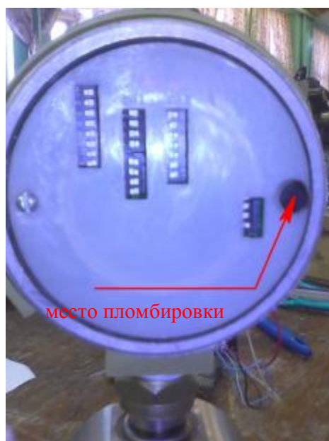
Рисунок 2 - Схема пломбирования