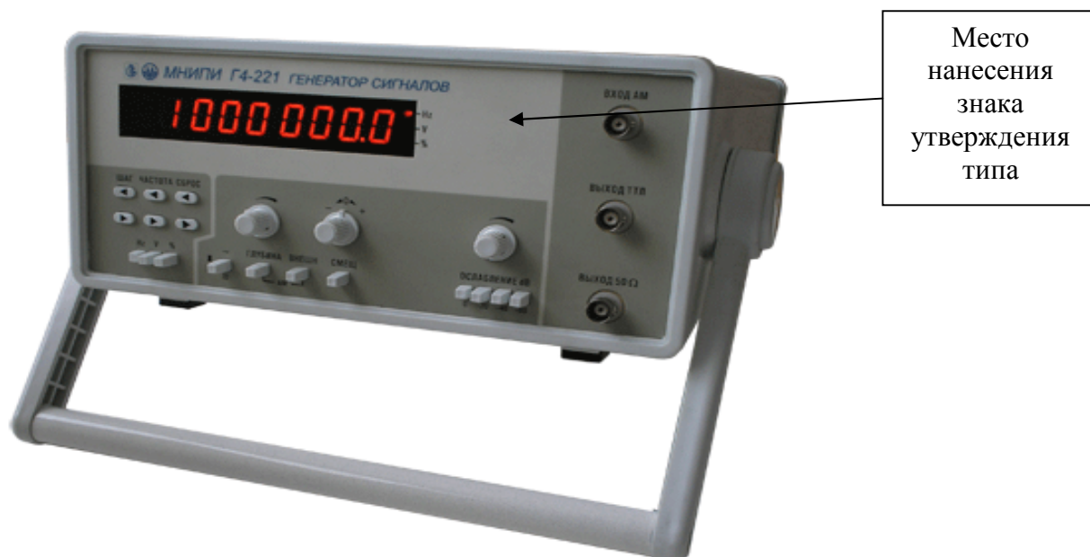
Рисунок 1 - Внешний вид генератора сигнала Г4-221

Внешний вид генераторов сигналов приведен на рисунках 1 и 2, задняя панель генераторов сигналов – рисунок 3.