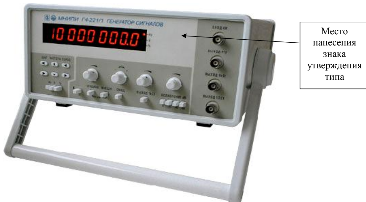
Рисунок 2 - Внешний вид генератора сигнала Г4-221/1