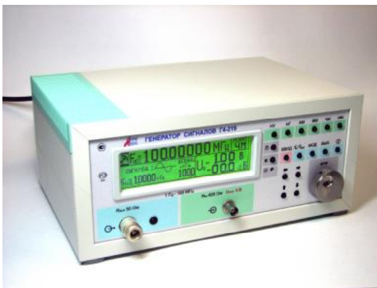
Рисунок 1. Общий вид генератора

Общий вид генератора представлен на рисунке 1. Места пломбировки и нанесения поверительных клейм указаны на рисунке 2.