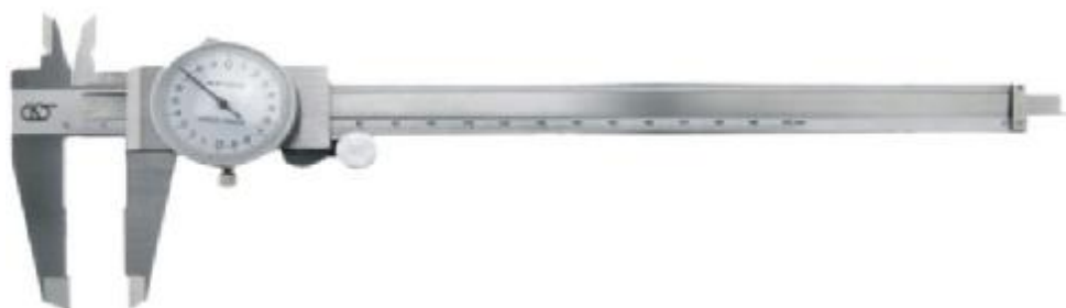
Рисунок 2 - Общий вид штангенциркулей ШЦК-I