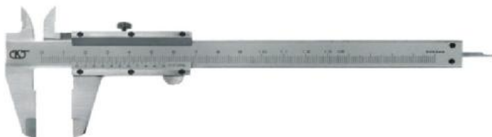
Рисунок 1 - Общий вид штангенциркулей ШЦ-I