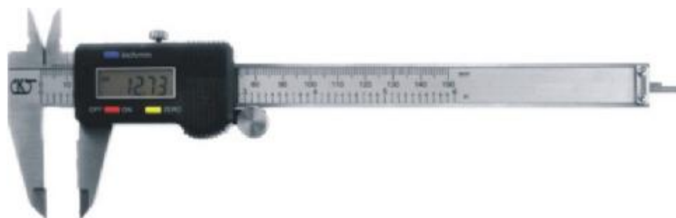
Рисунок 3 - Общий вид штангенциркулей ШЦЦ-I