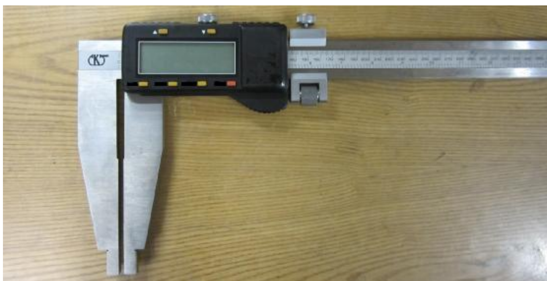
Рисунок 6 – Общий вид штангенциркулей ШЦЦ-III.