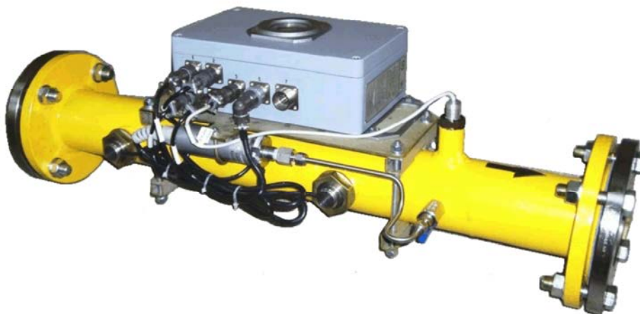
Конструктивное исполнение «Р»