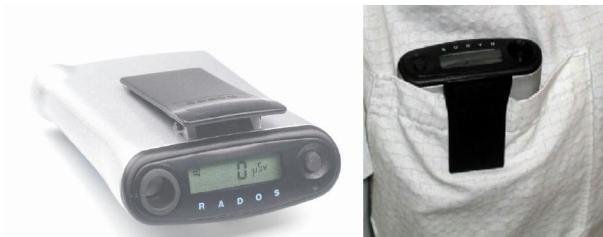
Рисунок 1 – Общий вид RAD-62S.

Фотография общего вида, схема пломбировки от несанкционированного доступа приведены на рисунках 1 и 2.